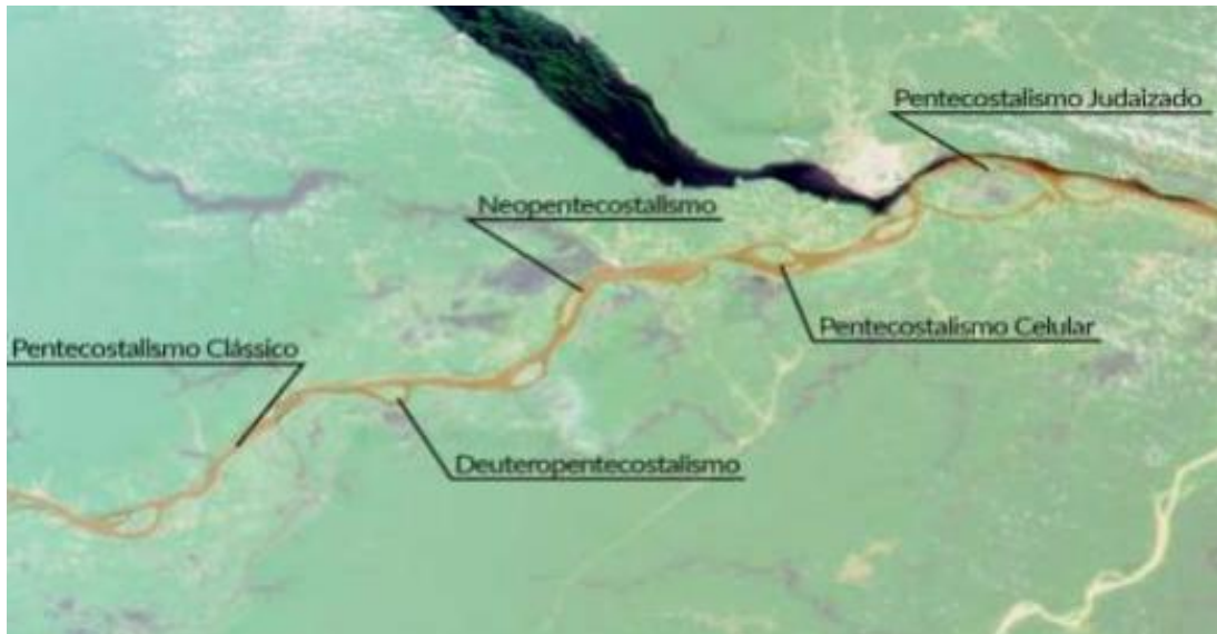
Imagem 02: O rio pentecostal